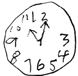
Nombor yang hilang