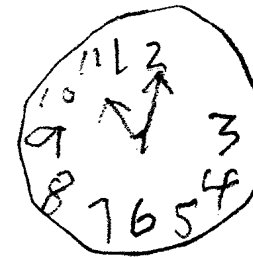
Faltan algunos números